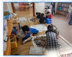
細かいところも綺麗にしてくれました

当日出席の学童さんと一緒に大掃除をしました。お掃除上手な学童さん。集中して児童館をピカピカにしてくれました。