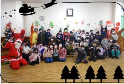
みんなで合奏をしました

待ちに待ったクリスマス会！今年1年、あまり行事がなかったので「学童さんに楽しんでもらいたい！」と考え、職員全員で「大きな箱 クリスマスVer」の劇をしました。いろんなキャラクターが出てきて「大きな箱」をみんなでひっぱると中からサンタさんが登場！今年最後の大笑いになりました。サンタさんの絵本の読み聞かせや、箱の中身はなんだろう？をした後には、児童館の中でプレゼント探しもしました！