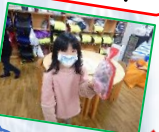
見て見て！プレゼントあったよー！