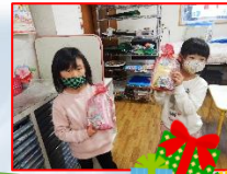
プレゼントどこにあるかな・・・